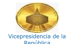
Vicepresidencia de la República