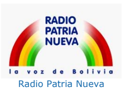
Radio Patria Nueva