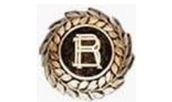
Presidencia de la República