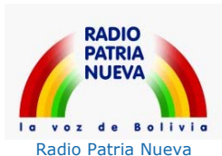
Radio Patria Nueva