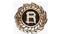
Presidencia de la República